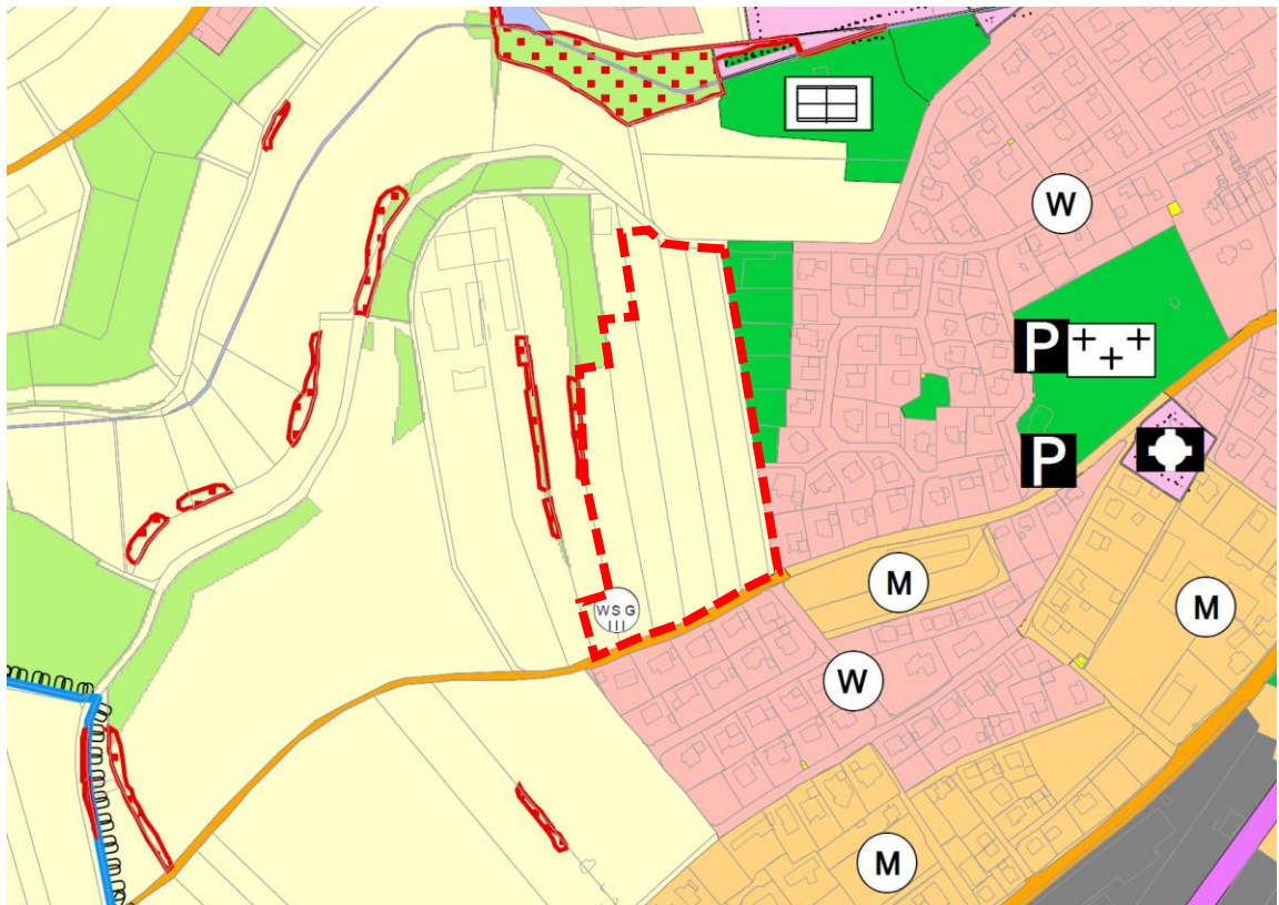
Ausschnitt aus dem wirksamen Flächennutzungsplan Ostrach mit schematischer Darstellung des Plangebietes (rot gestrichelte Markierung)

Durch diese Änderung wird die städtebauliche Ordnung im Kernort Ostrachs gewahrt und in sinnvoller Weise weiterentwickelt.