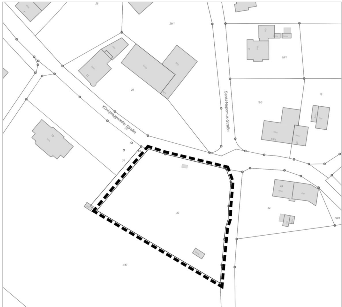
Abgrenzungslageplan mit Lage des Plangebietes (schwarze gestrichelte Umrandung)

Der Geltungsbereich schließt im Westen an bereits wohnbaulich genutzte Flächen an. Im Norden begrenzt der Verlauf der Königseggwalder Straße (L 288) das Plangebiet. Im Osten wird es von der Gemeindeverbindungsstraße mit der Flurstücksnummer 481 gefasst. Die genaue Abgrenzung ergibt sich aus dem beigefügten Planausschnitt.