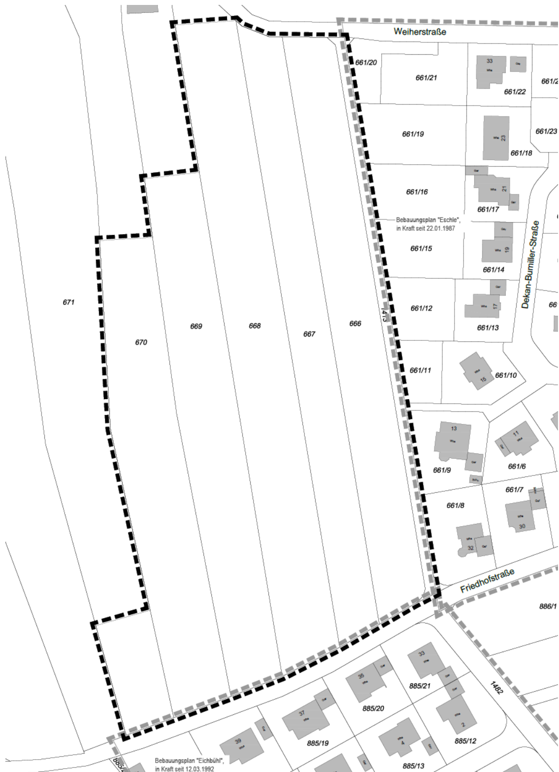
Abgrenzungslageplan mit Lage des Plangebiets (schwarz gestrichelte Umrandung) sowie Geltungsbereiche angrenzender Bebauungspläne (grau gestrichelte Umrandung).