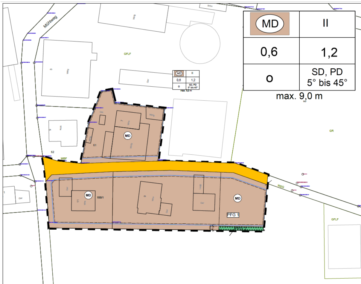
Abbildung 1: OT Laubbach Entwurf Bebauungsplan, IB Grossmann 04/03/2019

Bisher besteht innerhalb des Geltungsbereiches eine Mischung aus landwirtschaftlicher und wohnlicher Nutzung. Diese Mischnutzung soll erhalten bleiben. Ein randlich gelegenes Flurstück welches bisher als Grünland genutzt wurde, soll in den Geltungsbereich des Bebauungsplanes einbezogen werden.