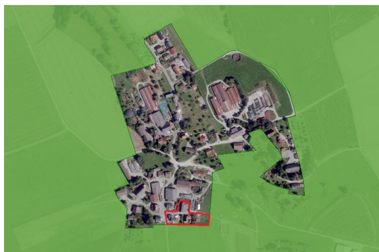
Abbildung 3: OT Laubach im LSG, LUBW 06/2018

Im Folgenden ist der Ortsteil Laubbach mit Geltungsbereich (rote Umrandung) und umgebendem Landschaftsschutzgebiet (grüne Fläche) dargestellt.