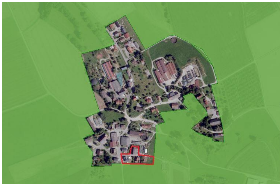
Abbildung 2: Geltungsbereich (rote Umrandung) und umgebendes Landschaftsschutzgebiet (grüne Fläche), LUBW 06/2018

Das Plangebiet grenzt im Süden und Osten an das Landschaftsschutzgebiet 'Altshausen-Laubbach-Fleischwangen' an.