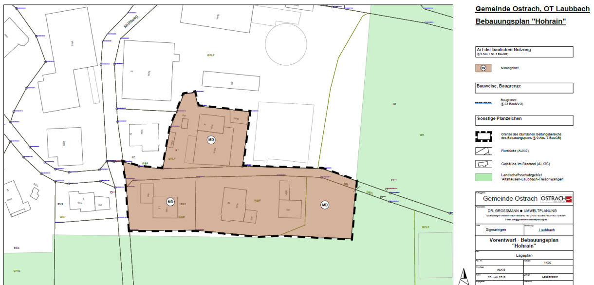
Abbildung 1: OT Laubbach Vorentwurf Bebauungsplan, IB Grossmann 06/2018

Bisher besteht innerhalb des Geltungsbereiches eine Mischung aus landwirtschaftlicher und wohnlicher Nutzung. Diese Mischnutzung soll erhalten bleiben. Ein randlich gelegenes Flurstück welches bisher als Grünland genutzt wurde, soll in den Geltungsbereich des Bebauungsplanes einbezogen werden.