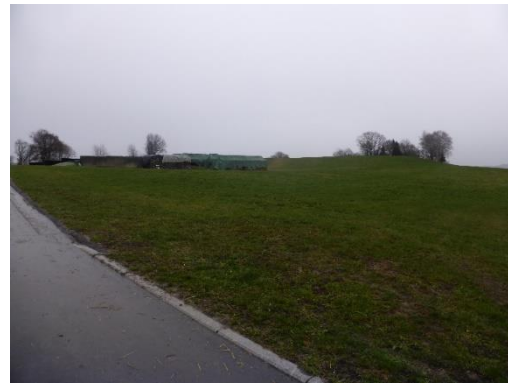
Foto 2: Feldweg entlang des Eingriffsbereichs und östliche Lagerflächen