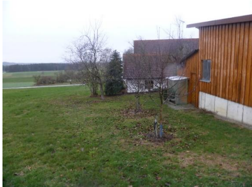
Foto 3: Südliche Grenze des Planungsbereichs zum angrenzenden Offenland