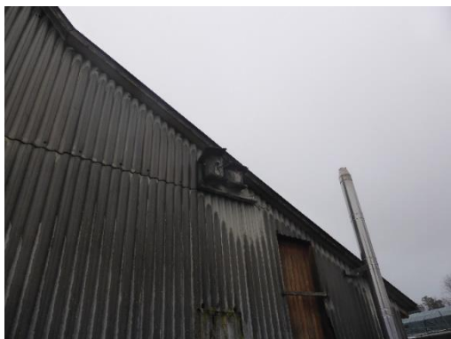
Foto 7: Nördlich innerhalb des Planungsbereichs gelegenes Landwirtschaftsgebäude