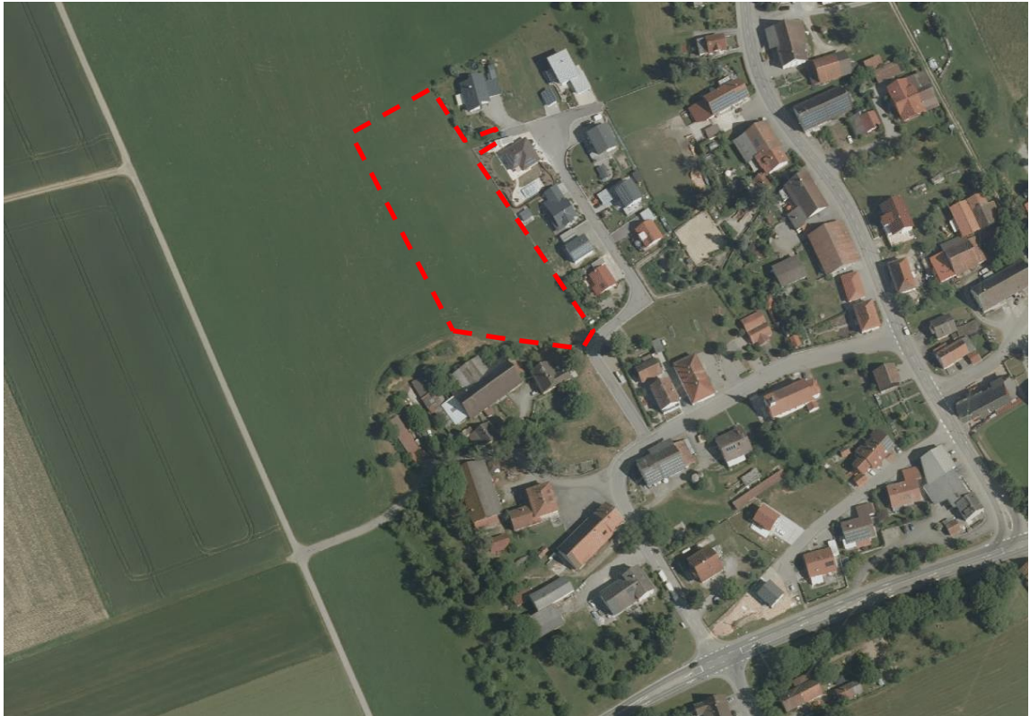
Abgrenzung räumlicher Geltungsbereich (ohne Maßstab)